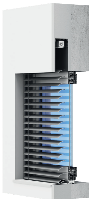
Venkovní žaluzie/podomítková C80