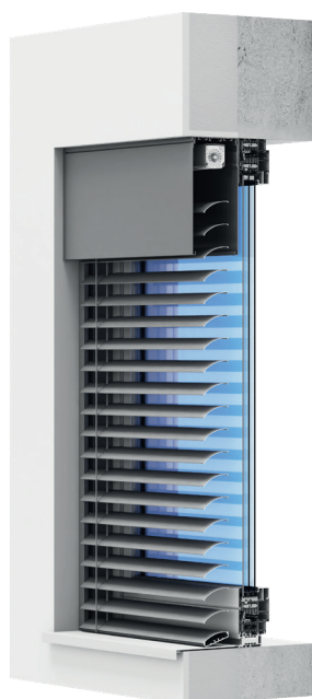
Venkovní žaluzie/adaptační C80