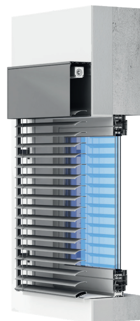
Venkovní žaluzie adaptační /fasádní / C80